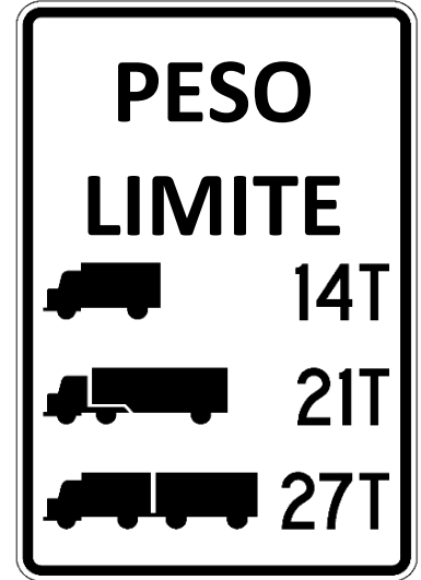
R12-5 Weight Limit (symbols)